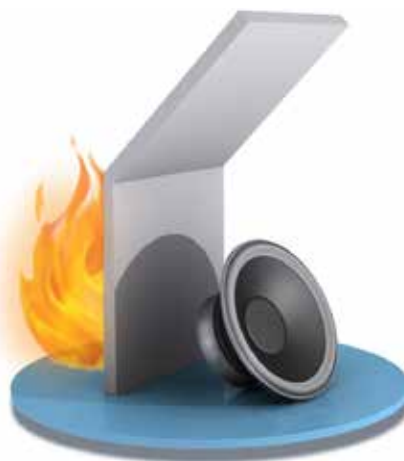
Platen kan brukes i veggkonstruksjoner hvor det stilles brann- og lydkrav.

Duripanel er CE-merket og oppfylder kravene i EN 13986