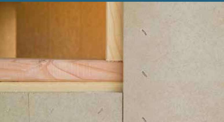
Duripanel montert med kramper