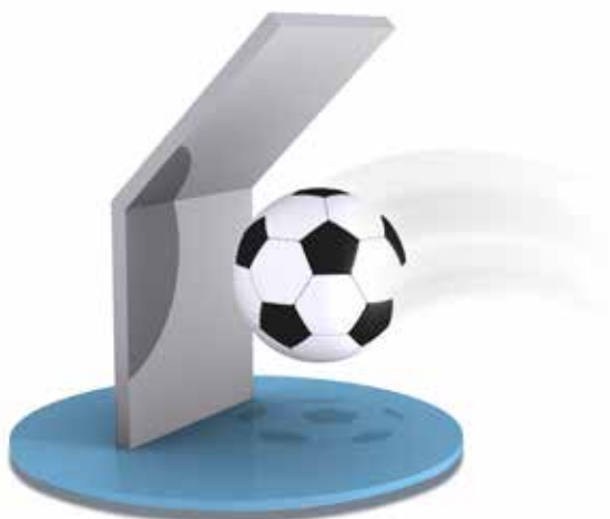
Platen tåler påvirkning av støt og moderate slag.